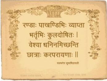
2nd subhashit hastamaithun Vallabhdev Subhashitavalli वल्लभदेव सुभाषितावली २ Click to see big picture

रण्डा: पाखण्डिभि व्याप्ता भर्तृभि: कुलदोषित: । वेश्या धनिमिच्छन्ति छात्रा: करपरायणा: ॥ _वल्लभदेव सुभाषितावली